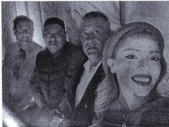
El 16 de septiembre del 2023 apoye con trofeos para realizar un cuadrangular de beisbol en categoría infantil en la Colonia Hidalgo.