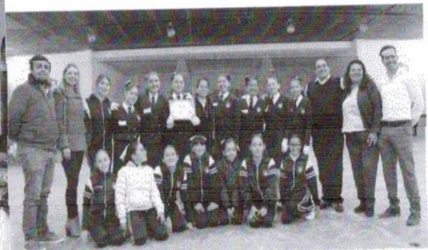
CONCURSO DE ESCULTAS AUDITORIO MUNICIPAL