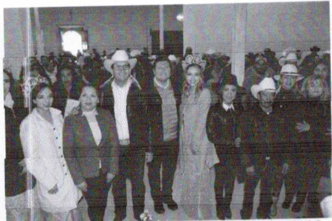
ENTREGA CONCURRENCIA CON MUNICIPIOS