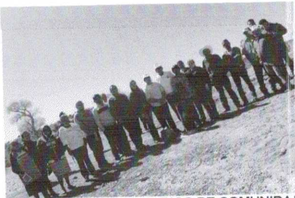
INAUGURACION DE AULA EN ESCUELA DIEGO ZACATECAS, COMUNIDAD DE BUENAVISTA