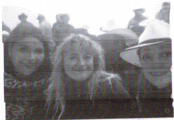
COMIDA SALON VICTORIA