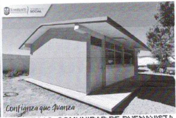
Confianza que Avanza