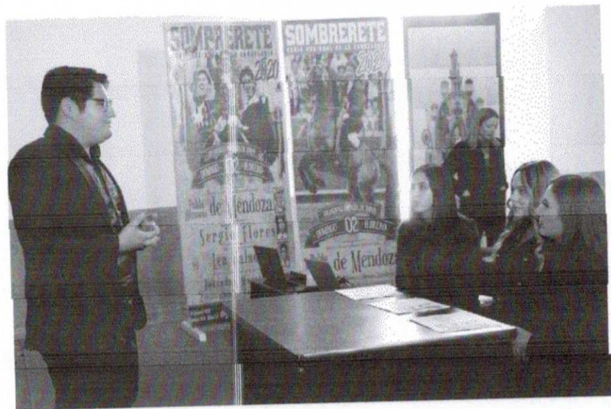
CAPACITACION A LAS CANDIDATAS A LA FERECA 2020