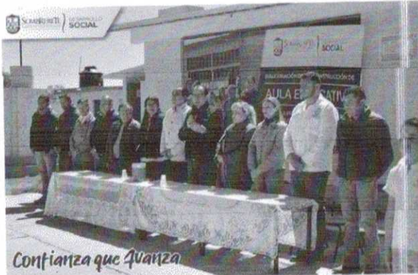
Confianza que Avanza