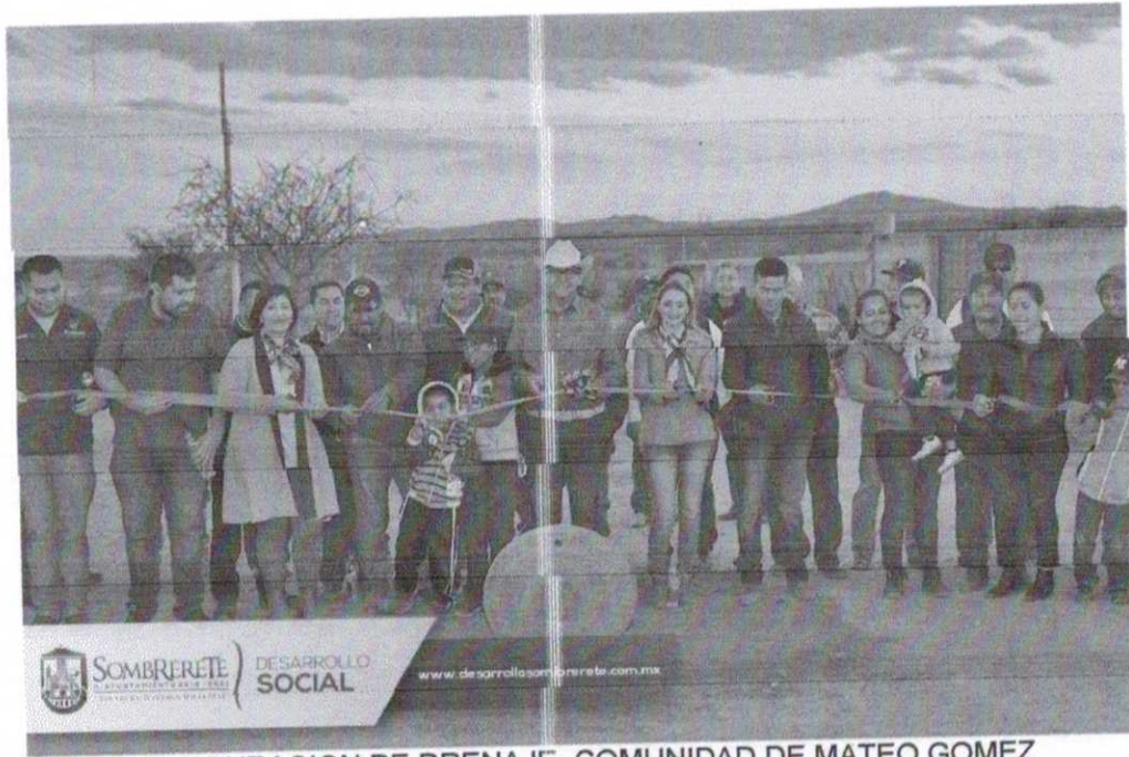
INAUGURACION DE DRENAJE, COMUNIDAD DE MATEO GOMEZ

Handwritten signature or initials in blue ink.