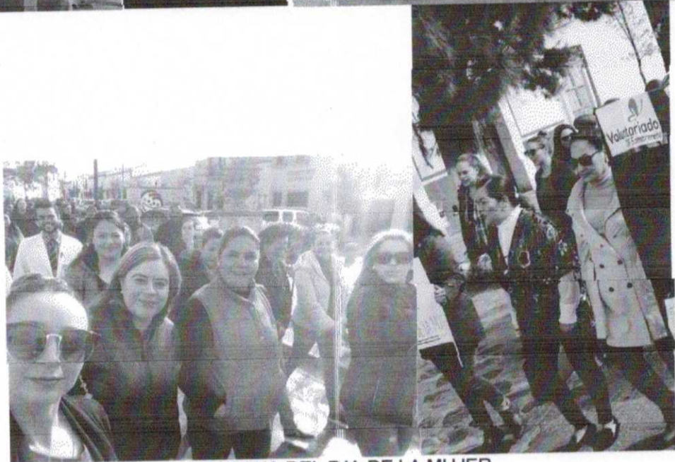
MARCHA DEL DIA DE LA MUJER