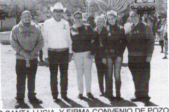
REUNION CON EJIDATARIOS DE COMUNIDAD SANTA LUCIA, Y FIRMA CONVENIO DE POZO