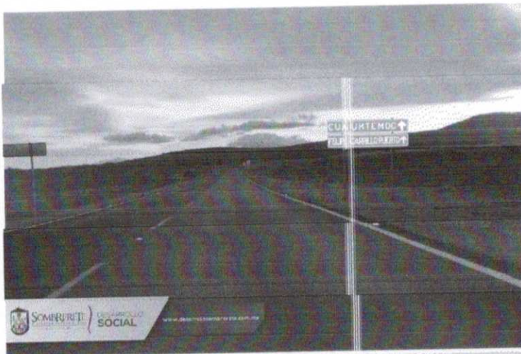
SAUZ DEL TERRERO