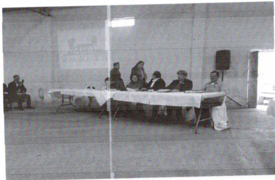
SESION DE CABILDO ITINERANTE EN HACIENDA ZARAGOZA