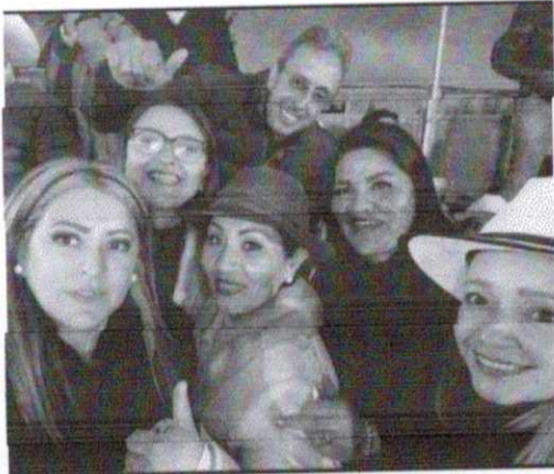
CORRIDA DE TOROS