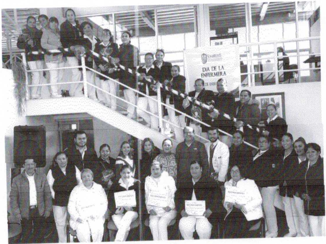
FESTEJO DE LA ENFERMERA