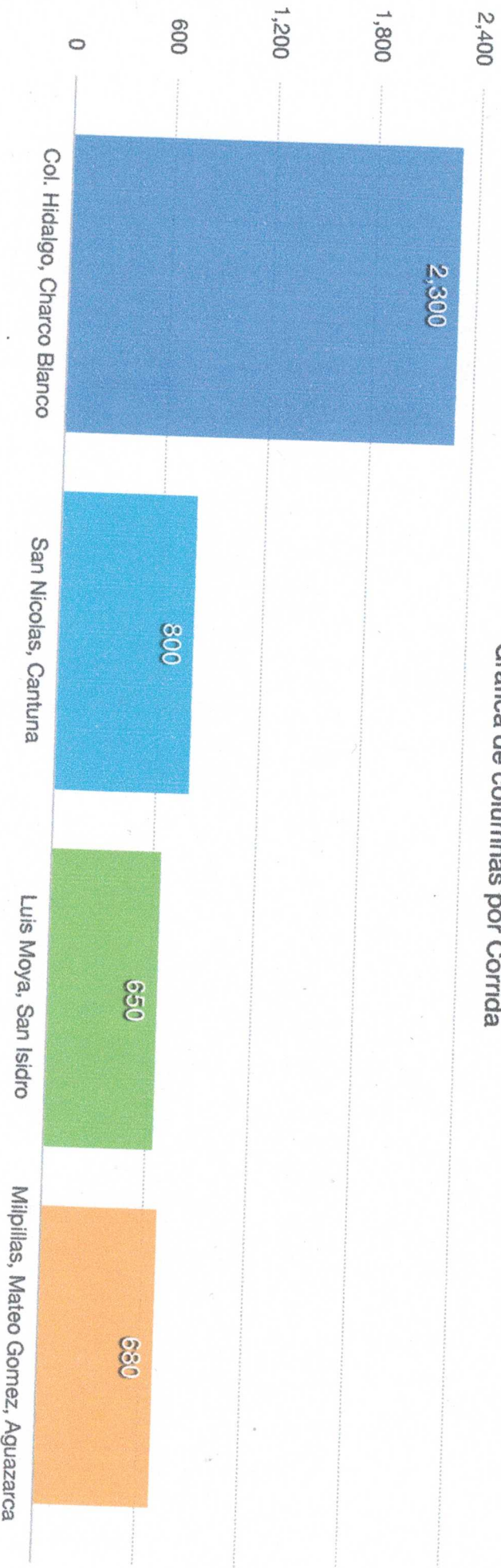
Gráfica de columnas por Corrida