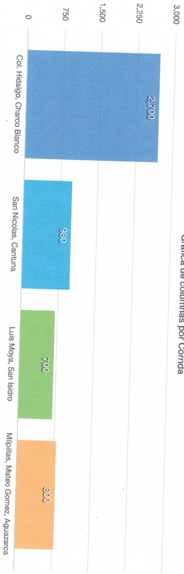
Gráfica de columnas por Corrida