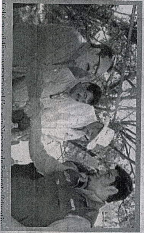
Calchasan al 45 aniversario del Consejo Nacional de Fomento Educativo